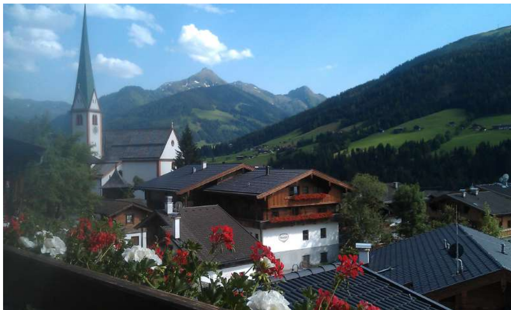
Bilden tagen i Alpbach i Österrike.